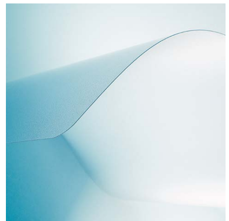
Für Hartböden mit VAB®-Haftschicht